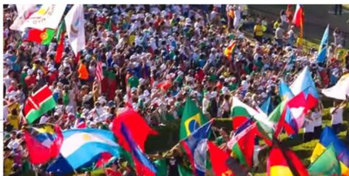
Weltjugendtagsinitiator hl. Johannes Paul II. ist einer der Schutzpatrone des WJT Seoul 2027