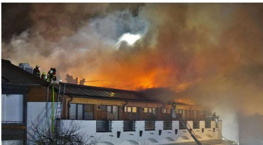
Einsatz am Limit: Mittenwalder Feuerwehr-Kameraden auf dem Dach des brennenden Hotelkomplexes.

Ein Großbrand zerstört den historischen Teil des Hotels Klosterbräu in Seefeld. Nur wenige Zentimeter trennten die Flammen von der Kirche. Diese blieb wie durch ein Wunder unversehrt. Auch die Einsatzkräfte aus Mittenwald kämpften gegen das Inferno.