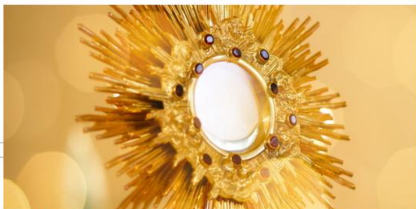
Eucharistische Prozession zum 250-jährigen Jubiläum der USA