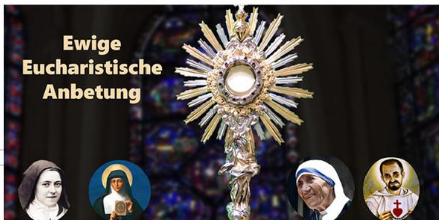
Jesus ist lebendige Gegenwart